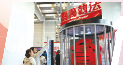
香港廉政公署ICAC调查员工作体验活动