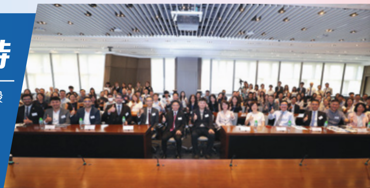
2025 国际数码诈骗防制与侦查研讨会

学系与本地及国际安全及执法机构保持紧密合作，并设有实地考察及业界讲座，让学生能及早接触真实工作环境。每年六月至七月提供本地及海外实习机会，实习机构包括执法部门、法律事务所及非政府组织。课程同时设有主题研讨会，邀请专家分享行业最新资讯与技术，协助学生掌握前沿趋势，强化未来职业竞争力。