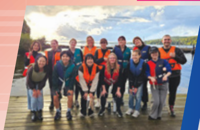
海外学生交换计划